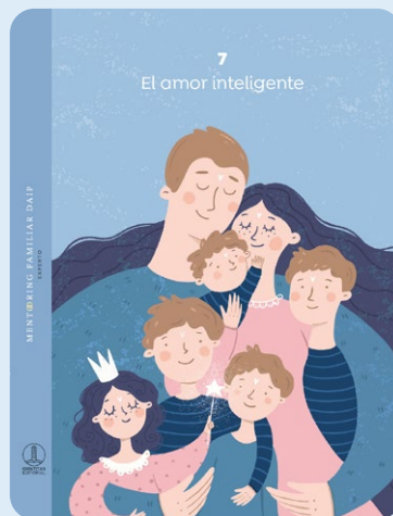
7 El amor inteligente