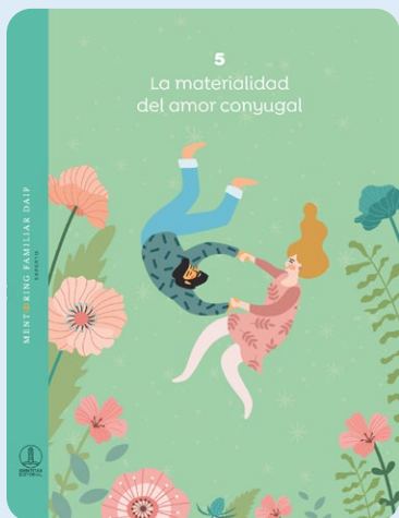
5 La materialidad del amor conyugal