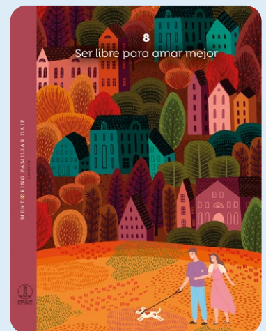
8 Ser libre para amar mejor