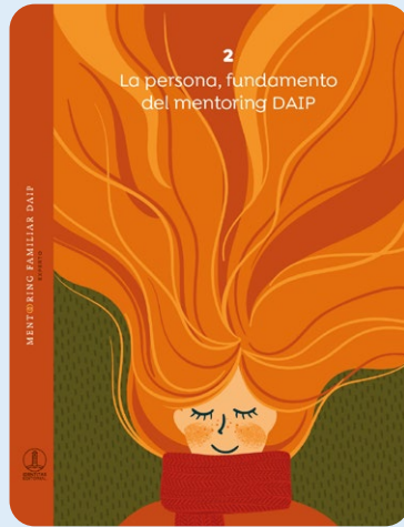
2 La persona, fundamento del mentoring DAIP