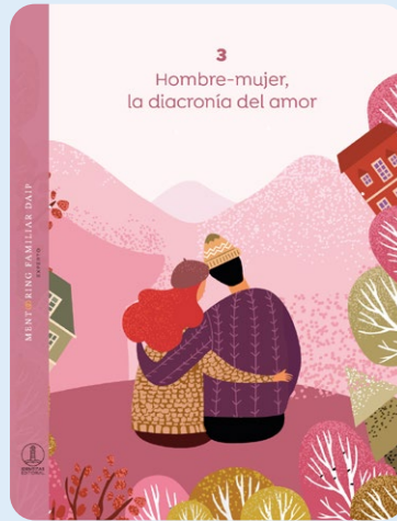
3 Hombre-mujer, la diacronía del amor