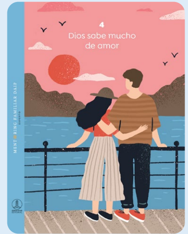
4 Dios sabe mucho de amor