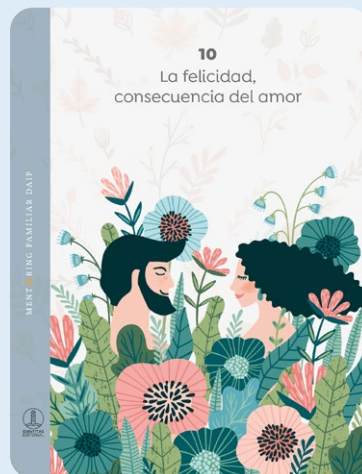
10 La felicidad, consecuencia del amor