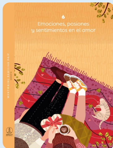
6 Emociones, pasiones y sentimientos en el amor